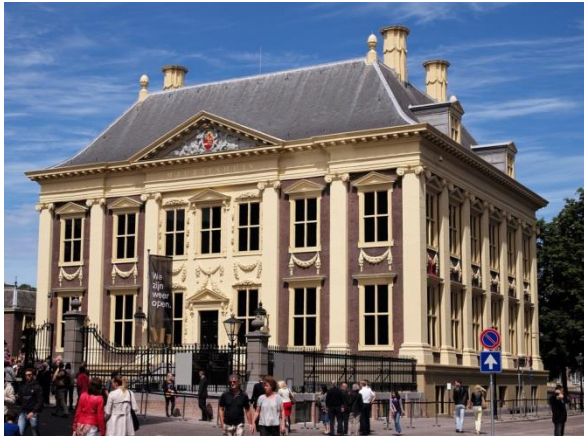
Mauritshuis Den Haag

De Rijksoverheid is samen met de Raad van Cultuur bezig met de verkenning van een nieuw cultuurbeleid voor de periode 2021-2024. Het nieuwe beleid wil steden en stedelijke regio's meer centraal gaan stellen. Op dit moment vinden daarvoor overleggen en onderzoeken plaats. De VVD vindt de gemeente op dit gebied te passief. Wij zien liever een actieve lobby richting het Rijk om onze instellingen, zoals het NDT, Residentie Orkest, Nationale Theater, het Mauritshuis, maar ook het Gemeentemuseum, voldoende onder de aandacht te brengen.