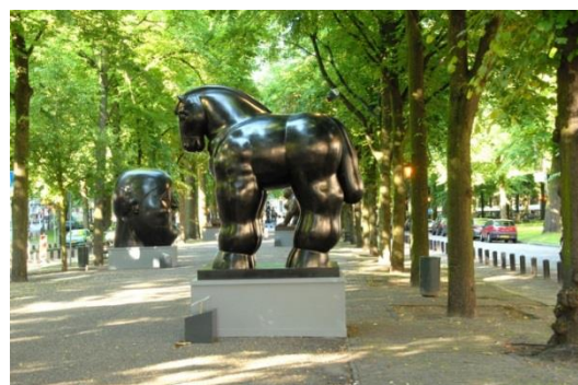
Sculpturen Lange Voorhout

De Haagse VVD wil dat de gemeente eens per jaar een tentoonstelling van kunst op het Lange Voorhout financiert (Den Haag Sculptuur moet terug). Ook willen we dat de gemeente kansen biedt aan ondernemers en kunstenaars om zelf exposities te organiseren, zoals de jaarlijkse open Atelierroute in het Benoordenhout. Hiervoor wordt