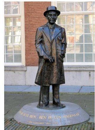
Louis Couperus aan het Lange Voorhout

Het Haags cultureel-historisch erfgoed en de archeologische rijkdom van de stad kunnen veel beter worden benut. De VVD wil dat er meer initiatieven worden toegestaan om dit vaker te laten zien aan het publiek. Een combinatie met kunstexposities kunnen dit nog interessanter maken voor een groter publiek.