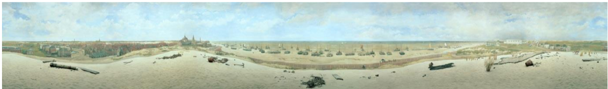
Panorama Mesdag (het grootste schilderij van Nederland)

De Haagse VVD ziet met deze plannen een mooie toekomst voor het kunst- en culturaanbod in Den Haag.