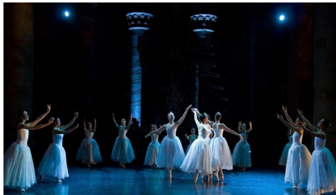
De Notenkraker in de Grote Kerk Den Haag